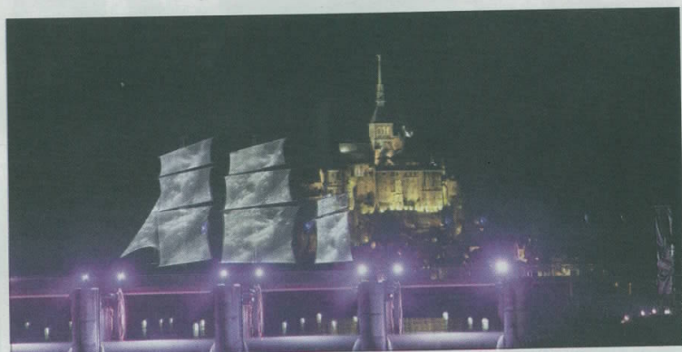
La société Contact faisait partie du groupement d'entreprises en charge de la réalisation du grand spectacle inaugural du caractère maritime du Mont-Saint-Michel.